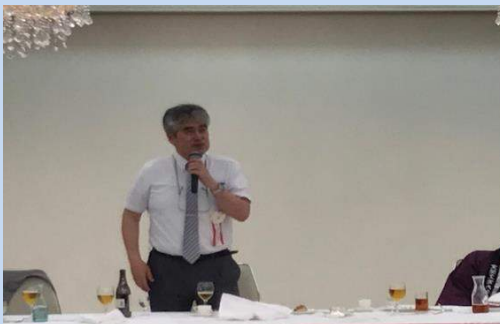
懇親会② 戒理事長より工大祭支援の要請あり。