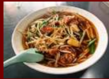
ベトコンラーメン