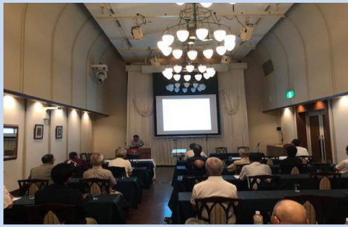
特別講演会② たいへん立派な会場でした。