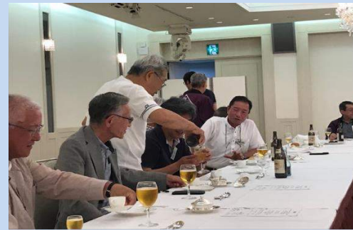
懇親会① ご歓談されています。