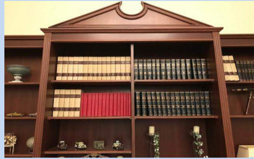
総会② 会場のアカデミックな飾り。