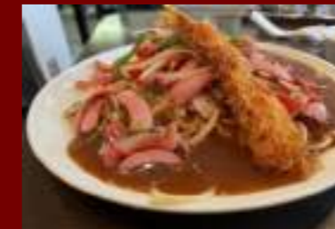
あんかけスパゲティー