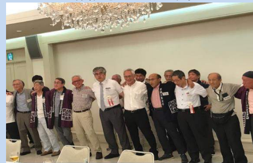
懇親会③ 「北斗の光」熱唱！素晴らしい！