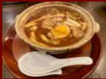
味噌煮込みうどん