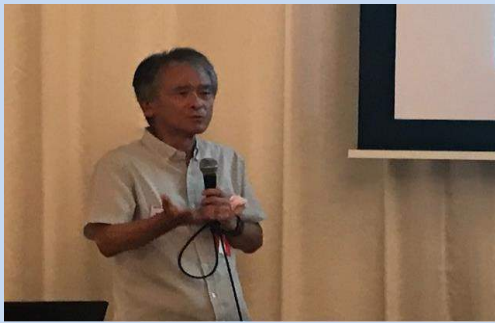
特別講演会④ 熱心にお話され、とても丁寧でした。