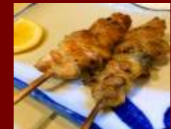
名古屋コーチン焼き鳥