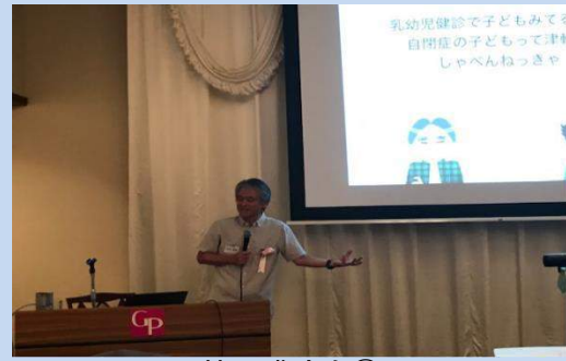
特別講演会③ ご専門の話でも、とてもわかりやすい。